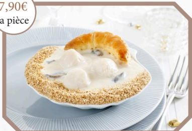
Coquille Saint-Jacques aux 3 noix