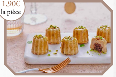
Mini-cannelés canard et figues