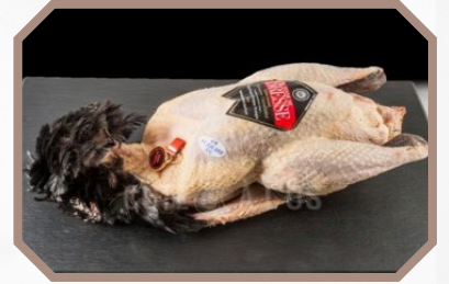
Dinde de Bresse