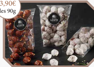
Au choix- sachet de 90g : * Mini saucisson sec * Mini chorizo