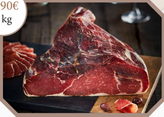
Jambon sec Ibérique