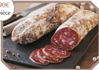
Saucisson sec italien à la truffe