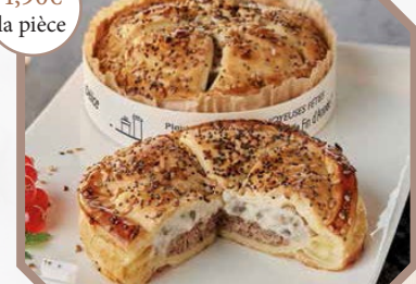
Tourte canard champignon forestiers