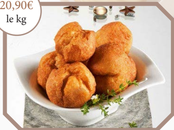
Pommes dauphines artisanales