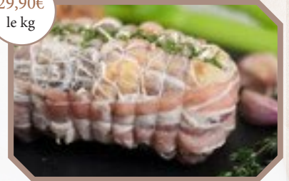
Rôti de pintade farci