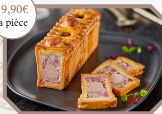
Au choix : * Mini-cocktail au canard et foie de canard- ~500g * Mini-cocktail canard pistaché- ~500g