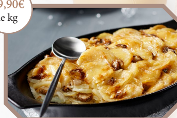
Gratin dauphinois aux cèpes