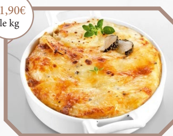
Gratin de pommes de terre à la truffe d'été

Vous pouvez également commander nos spécialités habituelles.