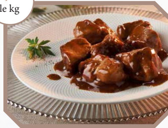
Sauté de porcelet à la bière de Noël et sirop d'érable