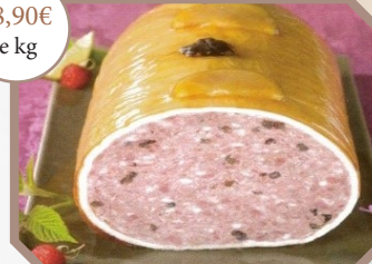
Galantine de chevreuil aux framboises