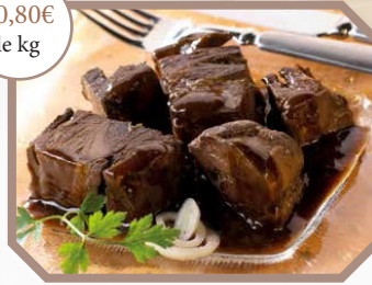
Sauté de biche à l'armagnac