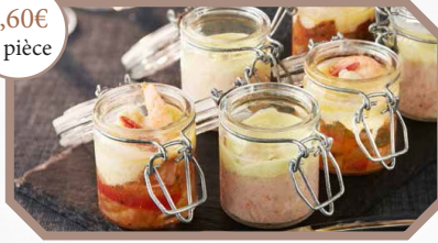
Au choix : * Mini bocaux de gambas à la crème d'ail et compositée de légumes * Mini bocaux de risotto de homard et topinambour