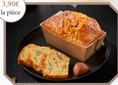
Cake de Noël au chapon, cèpes et marrons