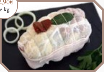
Rôti de chapon farci