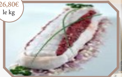
Rôti d'onglet beurre maitre d'hôtel