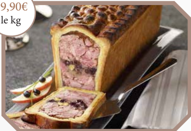
Paté en croûte de perdrix, pomme et cassis noir de Bougogne