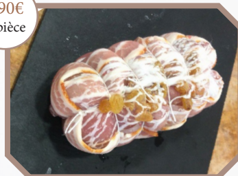
Rôti de caille farci