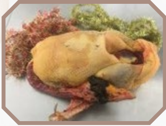
Oie fermière Label rouge