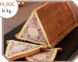
Pâté en croûte pyramide des saveurs