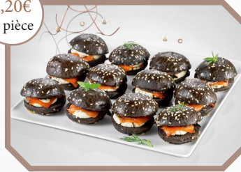
Mini burgers noirs au saumon fumé