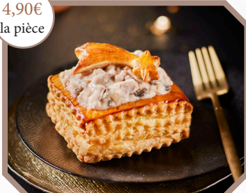
Vol au vent de chapon, champignons de Paris et morilles