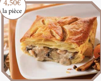
Feuilleté de volaille aux cèpes, sauce foie gras de canard