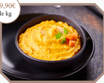
Purée de patates douces, pointe de canelle