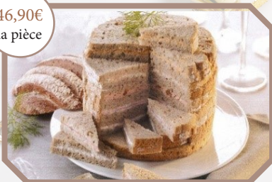
Pain surprise au choix : charcutier ou marin.