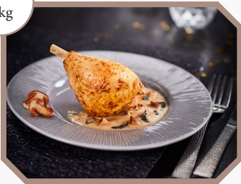
Chapon sauce crémée sauternes aux cèpes