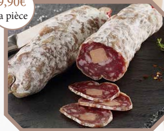
Saucisson sec au foie gras de canard