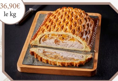
Demi-feuillantine de pintade aux saveurs d'automne