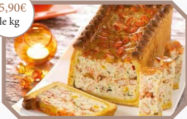
Pâté en croûte de brochet aux écrevisses de Louisiane