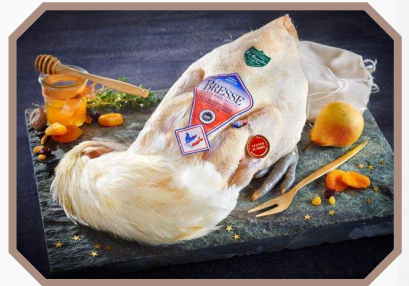
Chapon de Bresse