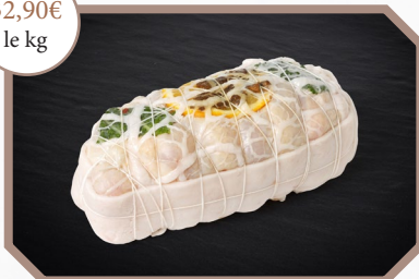
Rôti de poularde farci