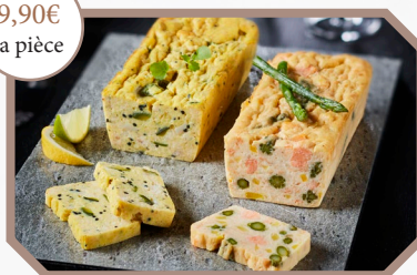
Au choix : * Mini pain Saint-Jacques saumon et asperges * Mini-pain saumon et asperge