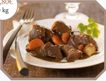
Civet de chevreuil sauce grand veneur