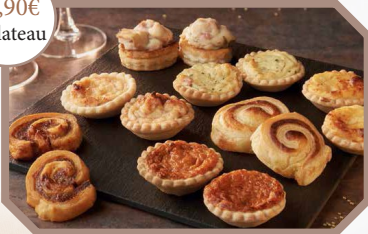
Assortiment de petits fours- plateau de 48 pièces