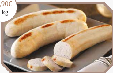
Boudin blanc truffé