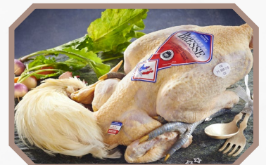
Poulet de Bresse