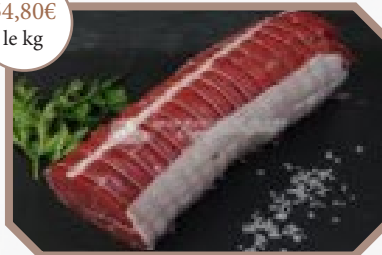
Filet de boeuf bardé