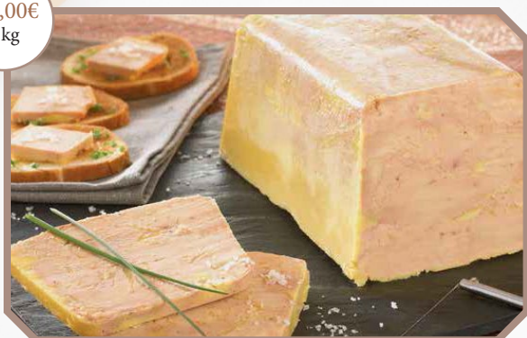
Foie gras maison