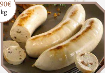
Au choix : * Boudin blanc nature * Boudin blanc aux morilles