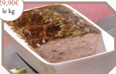
Terrine de caille aux raisins