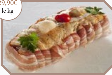
Rôti de canette farci