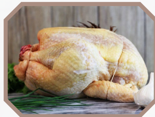
Mini chapon Label rouge (3Kg)