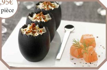
Oeuf de Noël au saumon et à la truffe