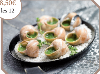
Escargots de Bourgogne