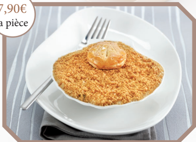
Coquille Saint-Jacques à la Bretonne