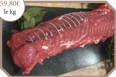
Filet de boeuf