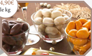
Au choix : * Cocktail boudin blanc * Cocktail boudin noir * Cocktail Francfort