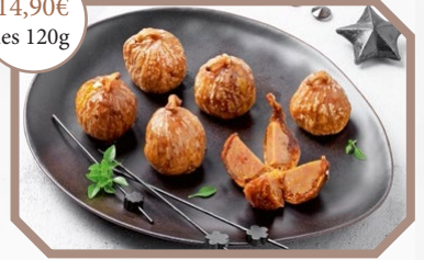
Mini figues farcies au foie gras- barquette de 6 x 20g